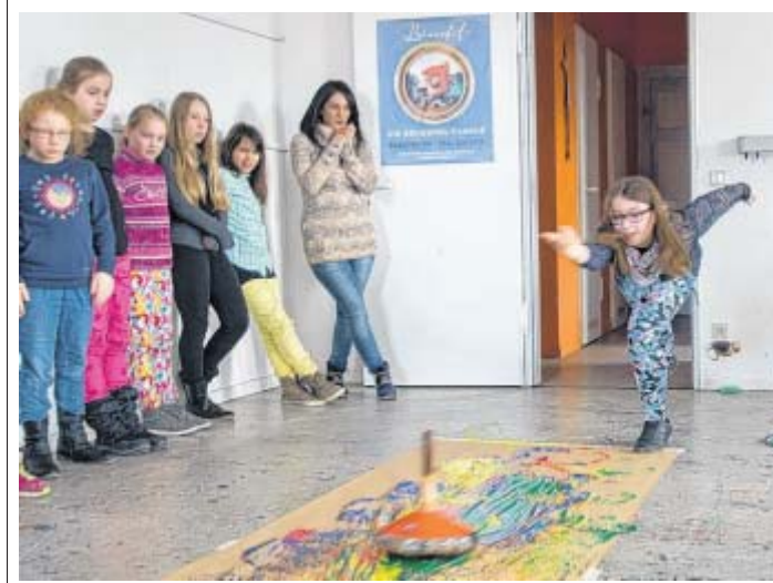
Mit Schwung: Diese Schülerin schießt ihren Eisstock über die Papierbahn.

In den vergangenen zwei Jahren feierten Hunderte Punkrockfans in der Kulturwerkstatt und unterstrichen den aus ihrer Sicht bestehenden Bedarf eines Festivals für diese Musikrichtung in Paderborn. Die Dukes, die 2014 ihren 25-jährigen Geburtstag beim Festival feierten, wollen die Gelegenheit zudem nutzen, um für ein besonderes Spendenprojekt zu werben. „Wir haben eine CD aufgenommen, die sich explizit mit dem Thema Tod auseinandersetzt“, beschreibt Wiegers sein Anliegen: „Die Einnahmen werden komplett an das Kinderhospiz Bethel gespendet. Bisher konnten wir so über 1.300 Euro sammeln.“ Der mit „Einschläge“ betitelte Tonträger wird beim Konzert für 5 Euro erhältlich sein oder kann über die Homepage der Band bestellt werden unter www.diedukesofthemist.de