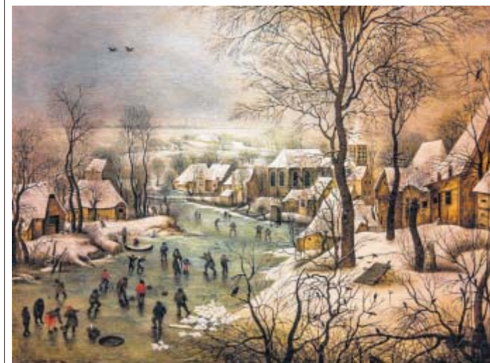
Die Inspiration: „Die Vogelfalle“ von Pieter Brueghel dem Jüngeren.